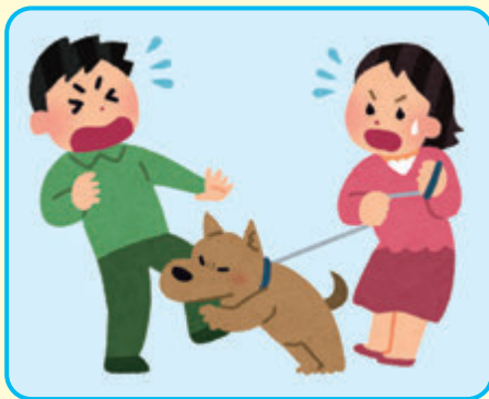
他人のペットによる負傷