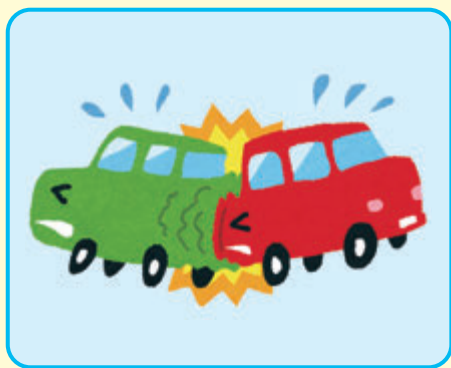
交通事故(車同士やバイク等)