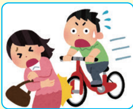
自転車による事故