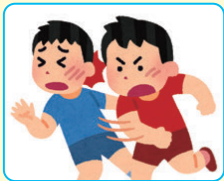
ケンカや暴力行為による負傷